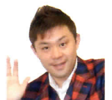
マジシャン コンプレッサー